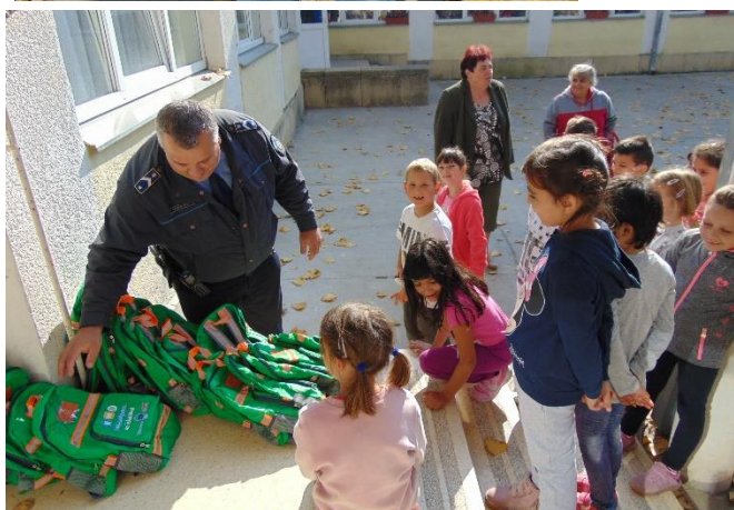
A Rendőrkapitányság ajándékát minden első osztályosunk átvehette az iskolarendőrünktől.