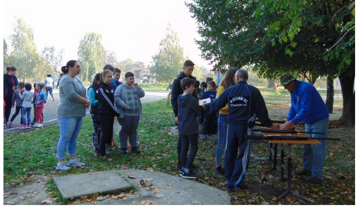
Fegyelmezett várakozás a lövészetre, a gyerekek a találati lőlapot hazavihették.