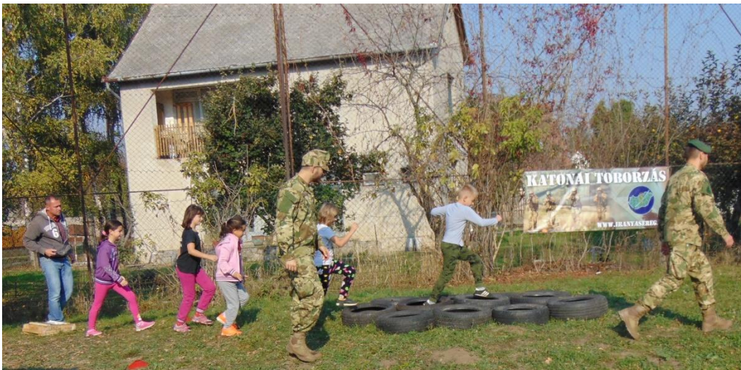
Az akadálypályán a szekszárdi Katonai Igazgatási és Érdekvédelmi Iroda munkatársai végig kísérték minden csapatot, vigyázva a gyerekek testi épségére.