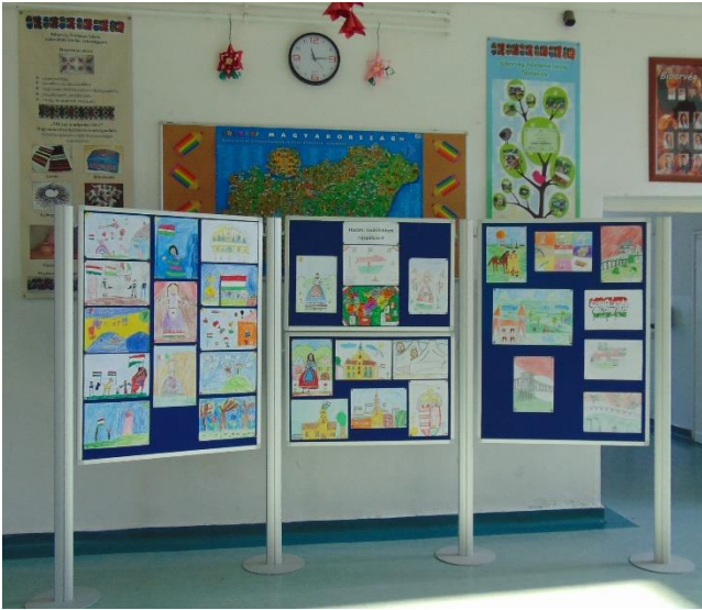
A rajzok kiállítása