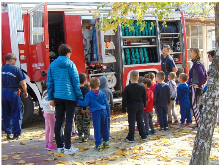
A tűzoltó autót még az óvodások is eljöttek megnézni!