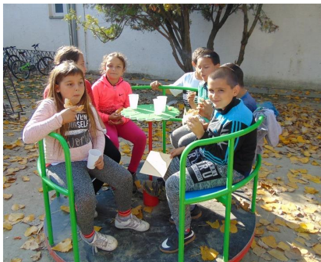
Megköszönve a közös munkát, vendégeink beszélgetés közben falatoztak velünk.