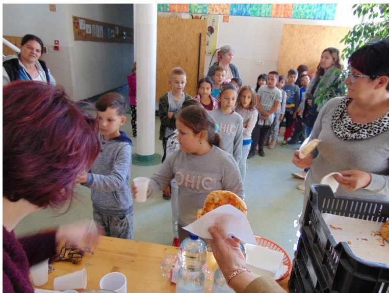
A programok végén, fáradtan, de élményekkel tele a tanulók jóízűen fogyasztották a pizzát.