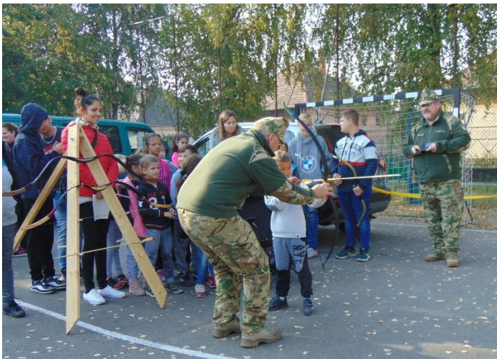
Íjászat – a legkisebbek is nagyon élvezték, hogy kipróbálhatták!