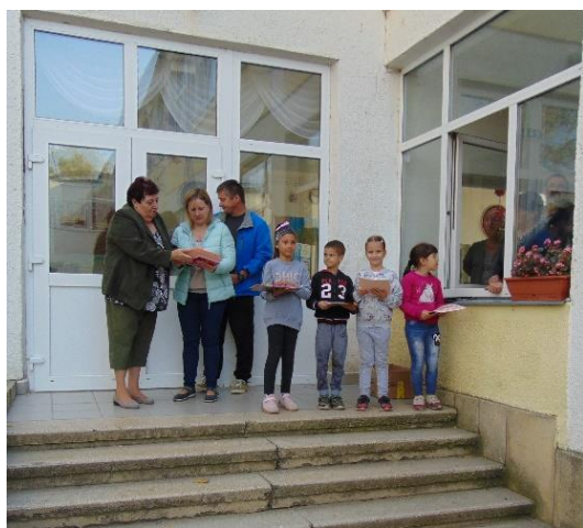
A rajzverseny eredményhirdetése A tanulók koresoportonként kaptak jutalmat.